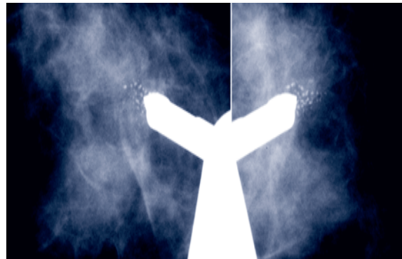
Computer-gesteuertes Vorschieben der Biopsienadel (Vergrößerungsbild).