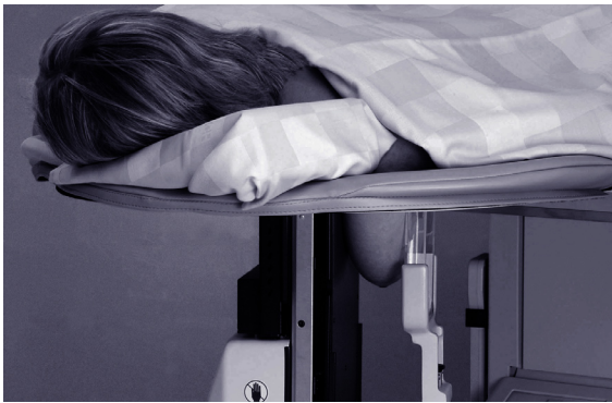
Bauchlage für die Gewebeentnahme.

Bei Ihnen wurde in der Mammographie (Bruströntgen) eine unklare Veränderung gefunden, welche mittels Gewebeentnahme weiter untersucht werden sollte, da es sich um eine bösartige Gewebeveränderung handeln könnte. Wir empfehlen Ihnen in dieser Situation, eine röntgenbild-gesteuerte Gewebeentnahme durchzuführen (stereotaktische Brustbiopsie). Diese Gewebeentnahme erfolgt in Bauchlage auf einem speziell dafür konstruierten Röntgentisch. Nach der Desinfektion und der lokalen Betäubung der Haut (Lokalanästhesie) wird durch die Ärztin/den Arzt eine Nadel unter Röntgensicht, computer-gesteuert, zu der unklaren Veränderung hingeführt. Sobald das Instrument richtig platziert ist, wird der unklare Gewebebezirk mittels Vakuum angesaugt und Schritt für Schritt entfernt (Mammotome®). Unter Umständen wird ein 3 Millimeter Metall-Clip an die Stelle der Gewebeentnahme gesetzt, um den Ort für zukünftige Mammographie-Bilder zu markieren. Die Einstichstelle an der Haut wird mit einem Klebeverband verschlossen (wasserdichtes Comfeel-Pflaster) und es wird Ihnen ein Verband um den Oberkörper angelegt.